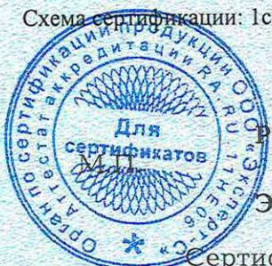
Схема сертификации: Ic