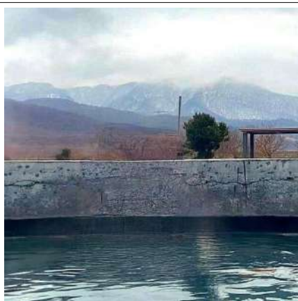
Термальный источник Бирагзанг

Вас ждет новый горный курорт Северной Осетии-Алании - Мамисон , где мы поднимемся на закрытом фуникулере на высоту 2 950м. Перед нами откроется величественная панорама на Великий Кавказский хребет. В самом сердце курорта на центральной площади Калак, археологи обнаружили Святылище христианской церкви , датируемое 7-9 веками, а недалеко от курорта находится музей под открытым небом Лисри , где 14 родовых 15-метровых башен и дома горцев создают сеть узких улочек, из-за чего Лисри ещё называют городом-лабиринтом.