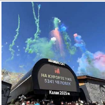
Горный курорт Мамисон

Вас ждет новый горный курорт Северной Осетии-Алании - Мамисон , где мы поднимемся на закрытом фуникулере на высоту 2 950м. Перед нами откроется величественная панорама на Великий Кавказский хребет. В самом сердце курорта на центральной площади Калак, археологи обнаружили Святылище христианской церкви , датируемое 7-9 веками, а недалеко от курорта находится музей под открытым небом Лисри , где 14 родовых 15-метровых башен и дома горцев создают сеть узких улочек, из-за чего Лисри ещё называют городом-лабиринтом.