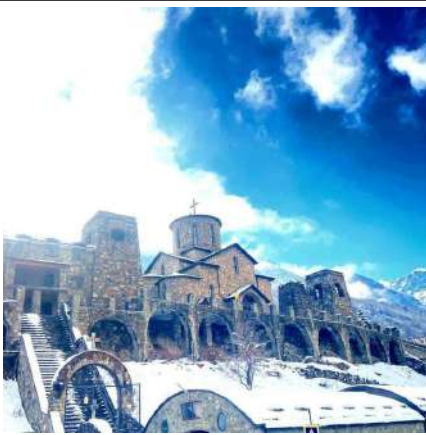
Аланский мужской монастырь

После дегустации отправляемся в Аланский Свято-Успенский мужской монастырь – самый высокогорный монастырь в России, который находится на высоте 2000 м. над уровнем моря. В лавке при монастыре можно приобрести религиозные сувениры и подарки близким, а также монастырский кагор.