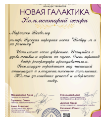
комментарий жюри 350 руб