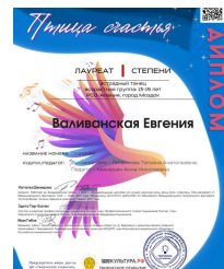
доп. электронный диплом 100 руб

*Если участником при оформлении заявки допущены ошибки и требуются исправления после того, как дипломы были отправлены, корректировки производятся после оплаты 50% от стоимости орг.взноса;