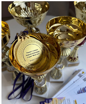
медаль, металл 500 руб