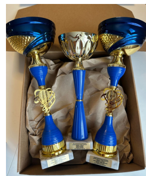
кубок именной 1700 руб