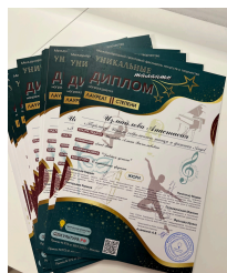
оригинальный диплом/благ.письмо 170 руб