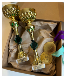
именной кубок 1700 руб