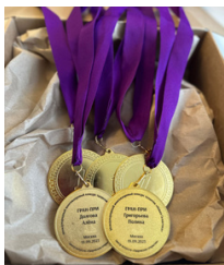
именная медаль 500 руб