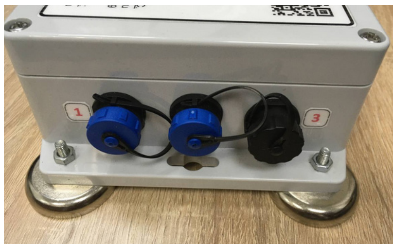
Рис. 5 - Разъемы трекера

Разъемы трекера нумеруются слева направо от 1 до 3. Левый (№1) предназначен для подключения коммутационной коробки № 2 (подключене компьютера по USB). Данный