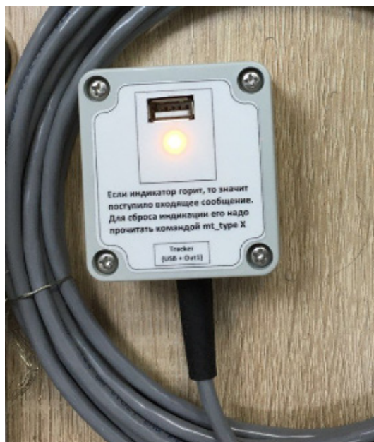
Рис. 4 - Коммутационная коробка № 2

Назначение – подключение компьютера к трекеру через прилагаемый в комплекте кабель USB и управление устройством через бесплатную программу «Galileosky Configurtor» (поставляется на прилагаемом в комплекте поставке флеш-накопителе). Коммутационная коробка снабжена встроенным индикатором желтого цвета для сигнализации о поступлении входящего сообщения на трекер. Загорается постоянно и горит до тех пор, пока оператор не подключит компьютер и не прочитает входящее сообщение. См. детали в «Инструкции по монтажу и эксплуатации».