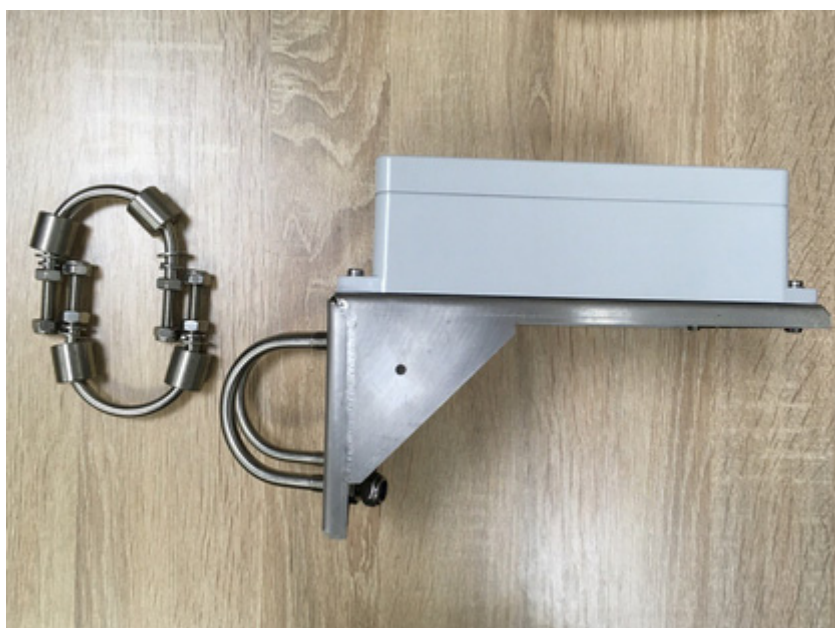
Рис. 6 - Крепление КТ-01

Крепление КТ-01 производства ООО «ВИДАР» является универсальным и подходит для размещения трекеров ТН-01, ТБ-01, ТБ-03, Lookout Marine 1.0/2.0. Поставляется вместе с паспортом, хомутами и комплектом крепежа трекера к креплению.