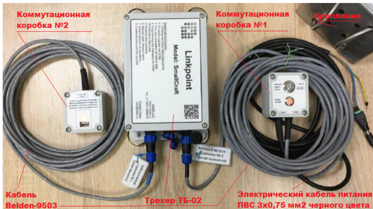
Рис. 1 - «Galileosky Base Block Iridium SmallCraft»