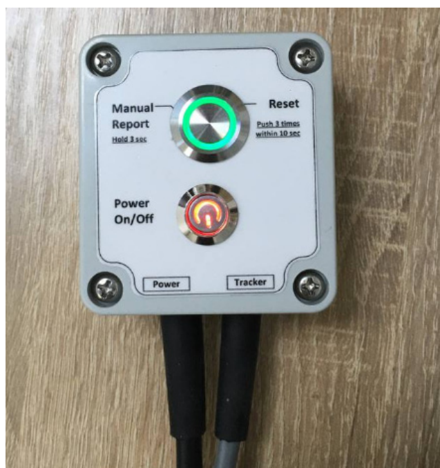
Рис. 2 - Коммутационная коробка № 1

Назначение – подача электропитания на трекер от блока питания (9-39 V DC), инициирование процедуры перегрузки устройства с кнопки и подача отчета о позиции в ручном режиме (вне расписания), индикация состояния работоспособности устройства.