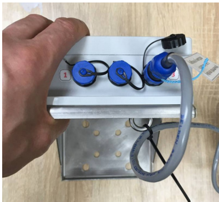
Рис. 7 - Крепление кабелей стяжками к рым-гайкам