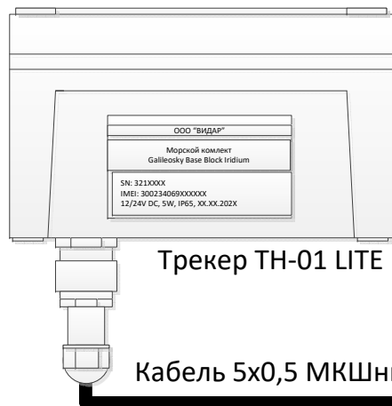
Схема подключения «Трекера ТН-01/ТБ-01 LITE» (коммутация для модели ONE)