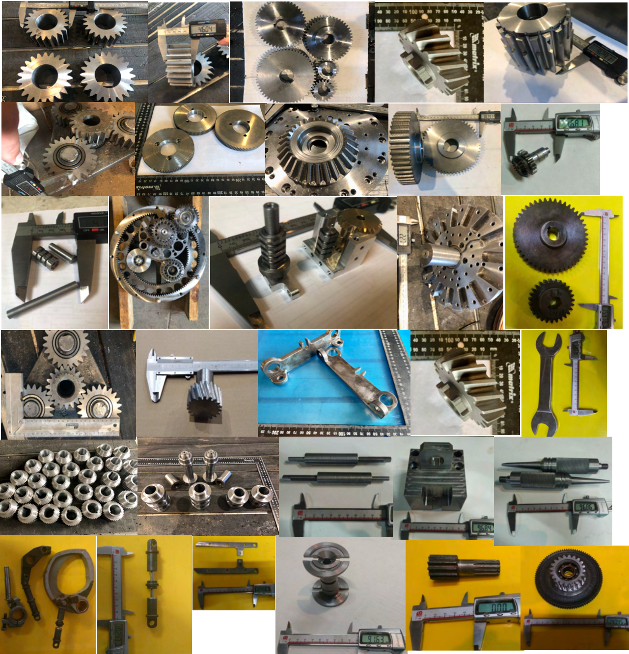
Изделия из цветных металлов (алюминий, дюраль, бронза)