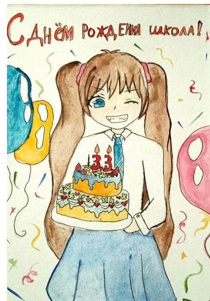
Рисунок Исроиловой Манижи, 8А