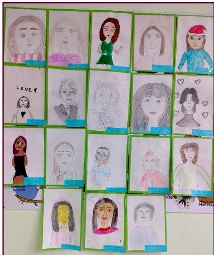
« Портреты наших любимых мам » рисунки учащихся 6-В класса

День Матери – это тёплый и сердечный праздник, посвящённый самому дорогому и близкому человеку. Спросите любого малыша, кто самый любимый человек на свете и непременно услышите: «Моя мама!» Для своих детей мама неизменно становится идеалом – доброты, ума, красоты. Она дарит ребёнку всю себя: любовь, доброту, заботу, терпение. Мама – самый главный человек в жизни каждого из нас.