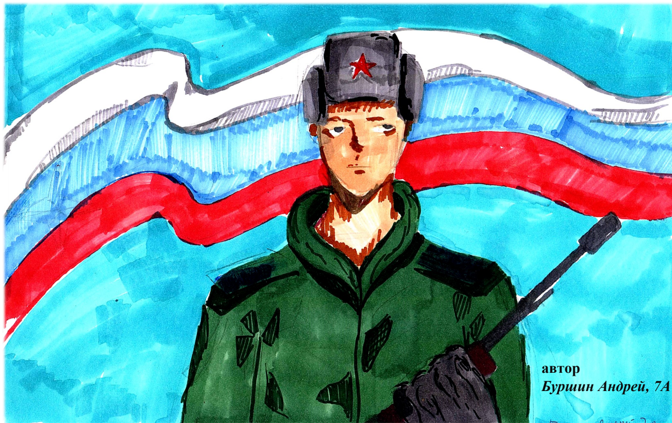
автор Буриин Андрей, 7А